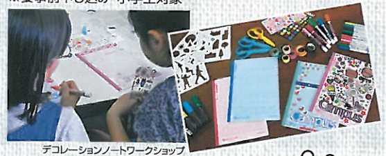
デコレーションノートワークショップ