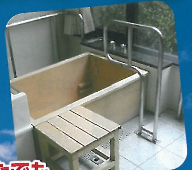
介護浴槽「個粹」展示