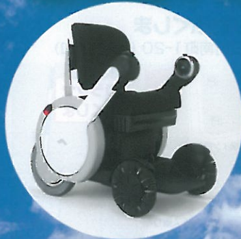
電動車いす "WHILL" 試乗